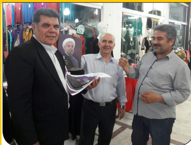
پخش پوستر و تبلیغات چهره به چهره در بازار آستارا توسط رئیس و اعضای ستاد مرکزی شهرستان بندر آستارا