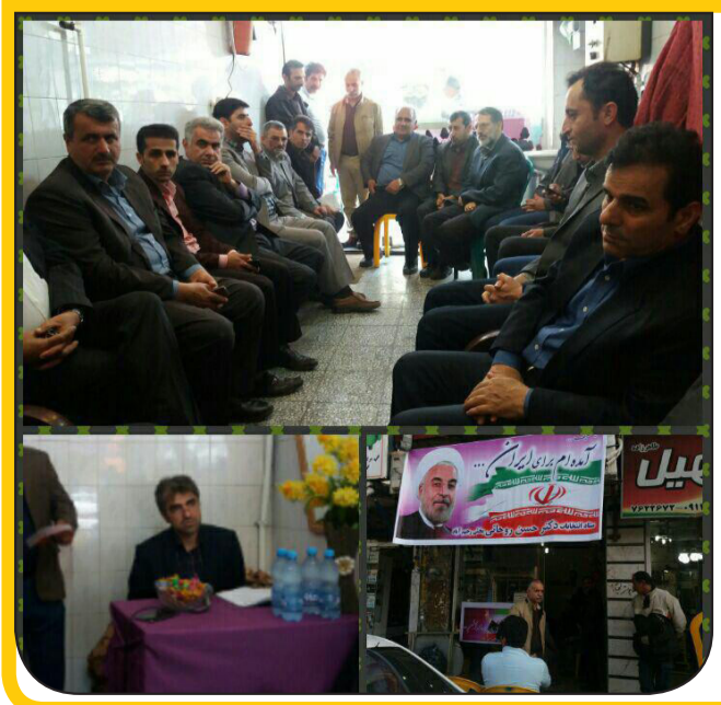
افتتاح ستاد انتخابات دکتر روحانی در رحیم آباد شهرستان رودسر