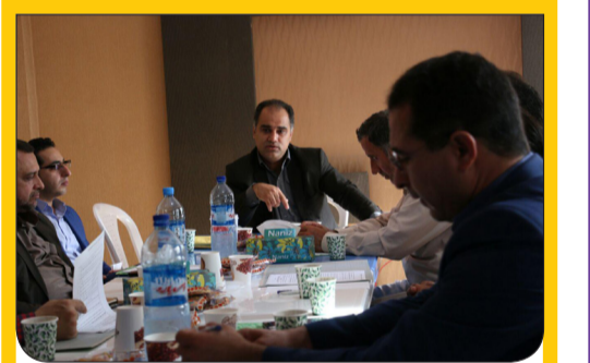
جلسه هم اندیشی معاونت های حقوقی ستاد شهرستانها و بانوان و جوانان در محل ستاد مرکزی استان تشکیل شد و حاضران به مدت دو ساعت به تبادل نظر و ارایه گزارش و هماهنگی ها ستادی و انتخاباتی در دو بخش حقوقی و فعالیت های میدانی مبادرت نمودند