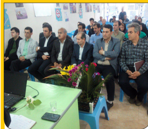
جلسه کمیته اساتید و دانشجویان، ستاد مرکزی دکتر روحانی در شهرستان تالش با حضور اساتید و دانشجویان شهرستان