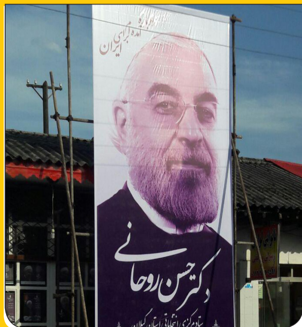
بازگشایی ستاد مرکزی دکتر حسن روحانی در شهر احمد سرگوراب شفت